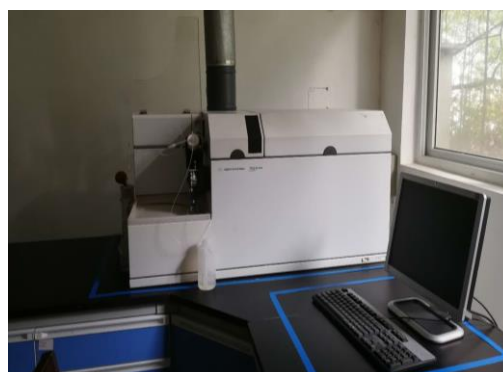
图 1 良好的检验环境

公司参照 ISO 14001 标准的要求，对工作场所的环境因素进行识别，并采取相应的防护措施。公司每年还举行多种活动，让员工参与安全环境改善工作。